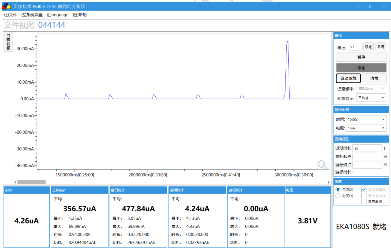
图 1 功耗分析图

如图 1 所示 使用“英加微功耗分析仪”测试以 5min 唤醒一次采集数据，休眠功耗为 4.26uA，工作状态为 4mA，联网发送数据时为 39mA,1 小时平均功耗为 356uA。