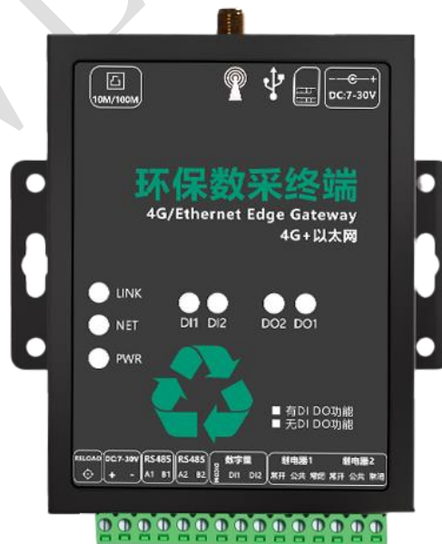
图 3 RTU 环保网关实物图