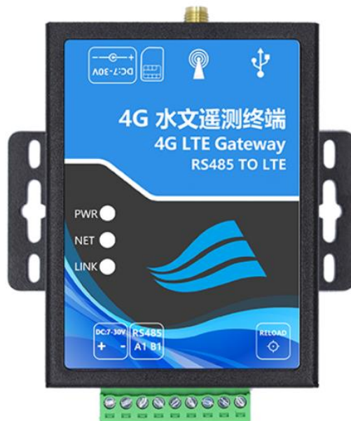
图 3 RTU 水文网关实物图