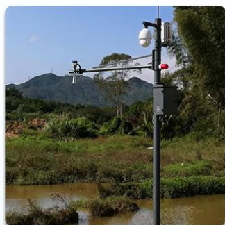
实时雨水情况监测