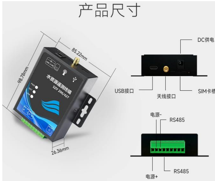
图 2 SZY206 水资源网关 RTU 插针引脚图 (TOP View)