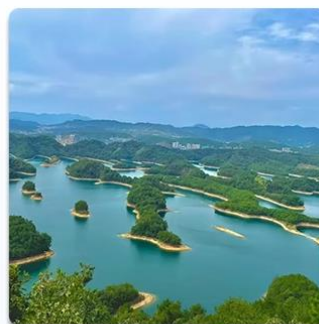
水源地水资源信息上报

SZY206 水资源网关采用先进的高度集成的硬件和软件平台，对众多常用的物联网平台协议进行了优化，完成无线接收、发射、数据采集处理和协议解析等功能，RTU 水资源网关结构尺寸为：83×85.5×27mm。可广泛应用于各个物联网领域，如工业数据采集、智慧农业、电力监控、环保污染监测、智能家居、安全管理、出行娱乐等场景。