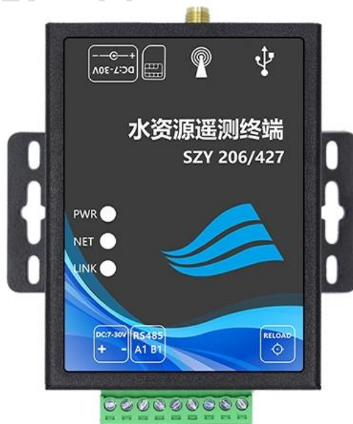
图 3 RTU 水资源网关实物图