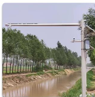
河道水文数据采集