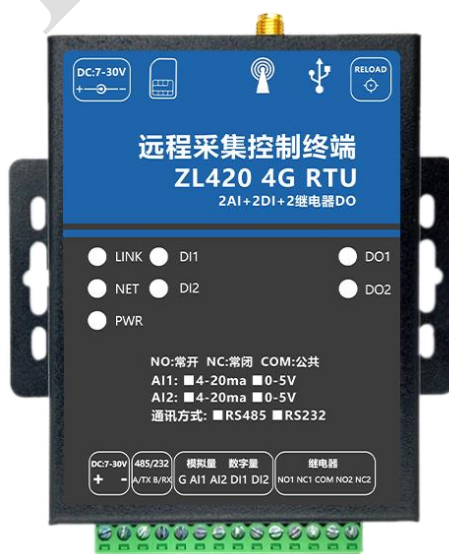
图 3 RTU 实物图