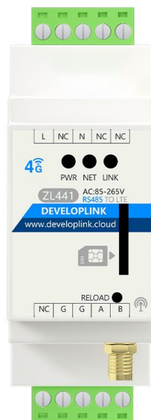
图 3 DTU 实物图