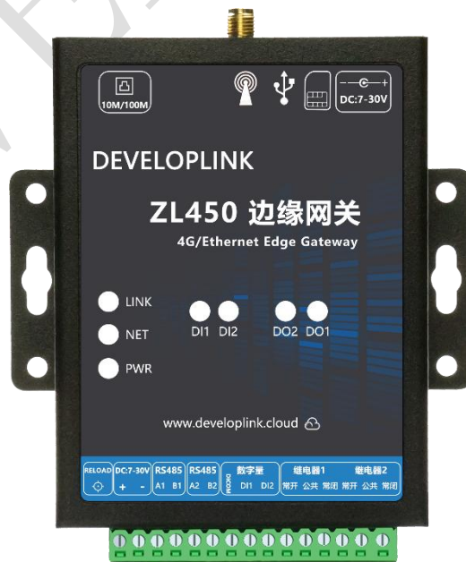
图 3 RTU 实物图