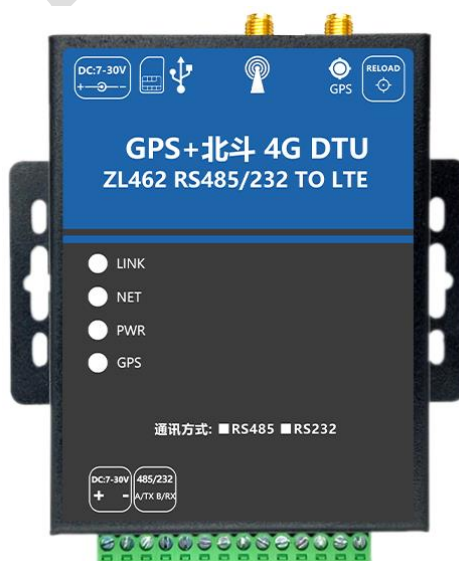
图 3 DTU 实物图