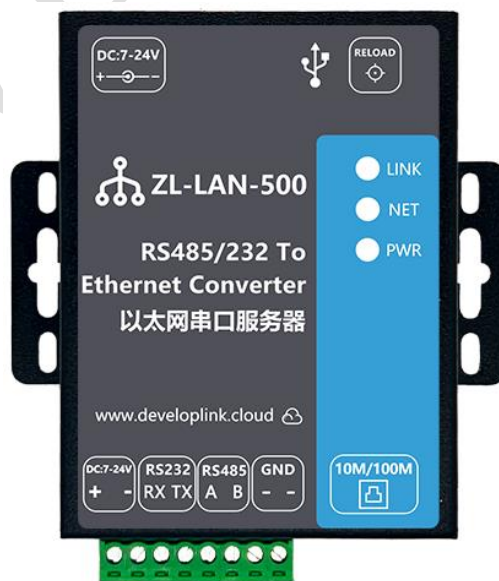
图 3 DTU 实物图