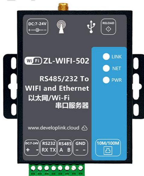
图 3 DTU 实物图